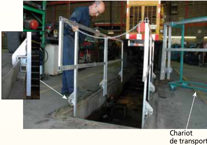
Chariot de transport

Par contre, il nécessite beaucoup de manipulations. On doit privilégier des sections en aluminium et un bon chariot pour les transporter.