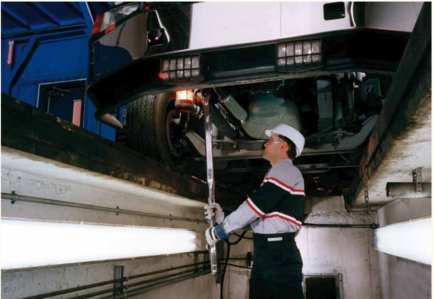
Figure 1. Une fosse de réparation.

Compte tenu de ces dangers, dans les bâtiments construits depuis août 2001, les garages d'entretien et de réparation doivent être pourvus de ponts élévateurs au lieu de fosses, à moins qu'elles soient nécessaires pour des raisons techniques.