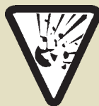
PRODUITS DE CONSOMMATION