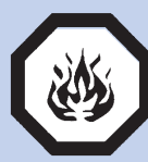
PRODUITS DE CONSOMMATION