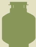
Bonbonne de propane