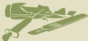
Aiguilles et sang contaminé