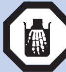
PRODUITS DE CONSOMMATION