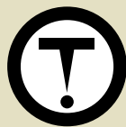
PRODUITS DE CONSOMMATION