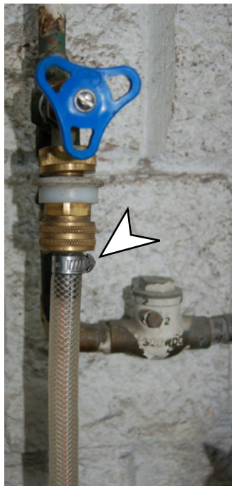
Le boyau d'origine s'est rompu sous l'effet de la pression.

La résistance du boyau est la principale cause de cet accident. Afin de prévenir qu'un tel événement ne se reproduise, je recommande de remplacer le boyau d'origine par un boyau offrant une meilleure résistance à la chaleur et à la pression et d'inspecter le boyau régulièrement.