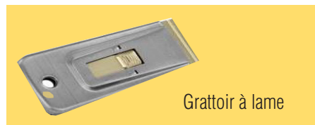
Grattoir à lame