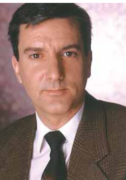
par MICHEL GAGNON Conseiller en hygiène industrielle, Auto Prévention