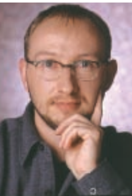
par JOCELYN JARGOT Conseiller en hygiène industrielle, Auto Prévention