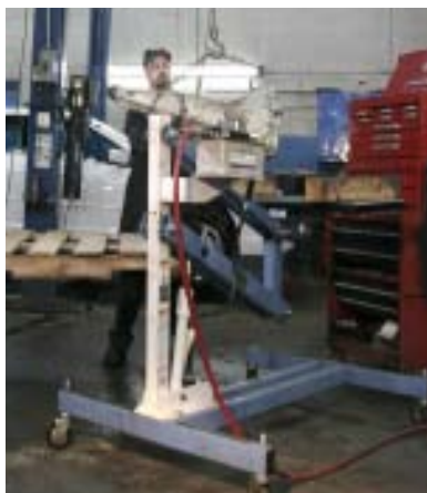
Certains établissements font l'acquisition d'équipements spécialisés.

Il est important d'utiliser des équipements qui permettent d'éviter ces tâches critiques. Le trépied de manutention présenté ici en est un très bon exemple.