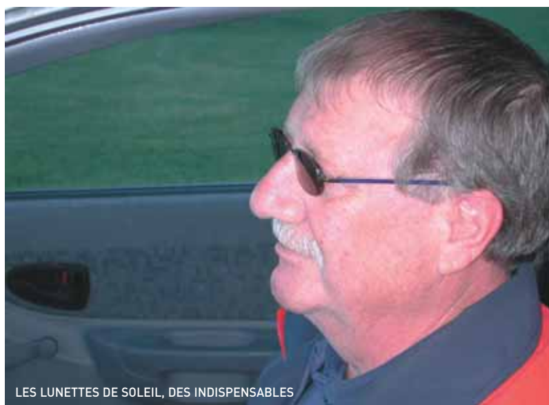
LES LUNETTES DE SOLEIL, DES INDISPENSABLES

Évitez de prendre la route dans des conditions de tempête, poudrierie, grêle, averse abondante ou brouillard. Si vous êtes déjà en route, réduisez votre vitesse de manière à pouvoir vous immobiliser à l'intérieur de l'espace visible. Si la visibilité est trop restreinte, quittez la chaussée, éloignez-vous-en le plus possible, puis activez vos feux de détresse.