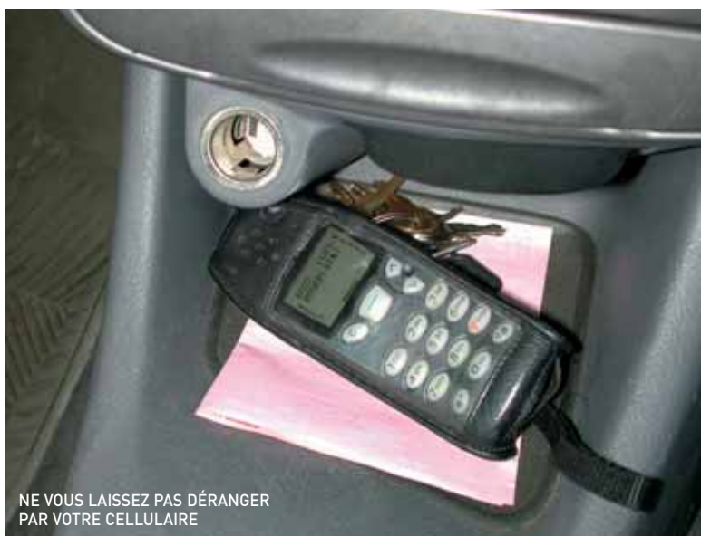
NE VOUS LAISSEZ PAS DÉRANGER PAR VOTRE CELLULAIRE

Si le cellulaire est très utile, il ne fait pas bon ménage avec la conduite d'un véhicule. Pour éviter tout danger, éteignez votre téléphone avant de prendre la route. Si vous devez absolument l'utiliser, rangez-vous dans un endroit sécuritaire ou demandez à un passager de prendre l'appel. Évitez d'accorder trop attention à d'autres sources de distraction comme le choix d'une station radiophonique, la recherche d'un objet, etc.