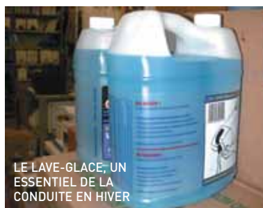
LE LAVE-GLACE, UN ESSENTIEL DE LA CONDUITE EN HIVER

La conduite automobile est avant tout basée sur la vision. C'est que l'œil reçoit 90 % des informations essentielles à la conduite. De là, l'importance de conduire avec des capacités visuelles optimales ou de porter