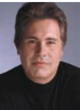
par MARTIN BONNEAU Conseiller en prévention, Auto Prévention

Matane Toyota est l'exemple qu'une excellente tenue des lieux est primordiale pour enrayer les risques d'accidents. Bien sûr, cette discipline exige une attention constante, mais l'expérience des établissements qui l'appliquent témoigne de son avantage à tous les points de vue!