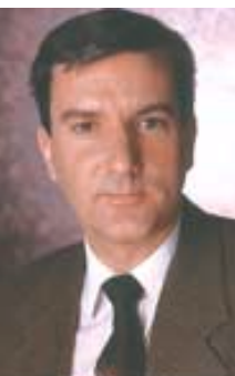
par MICHEL GAGNON Conseiller en hygiène industrielle, Auto Prévention