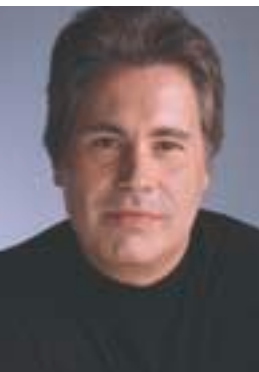
par MARTIN BONNEAU Conseiller en prévention, Auto Prévention