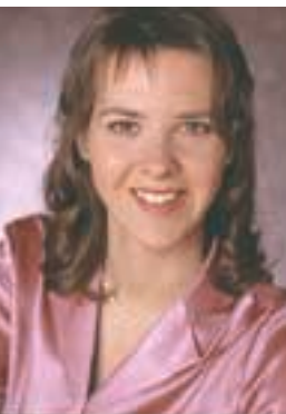
par MARTINE CHARETTE Conseillère en hygiène industrielle, Auto Prévention