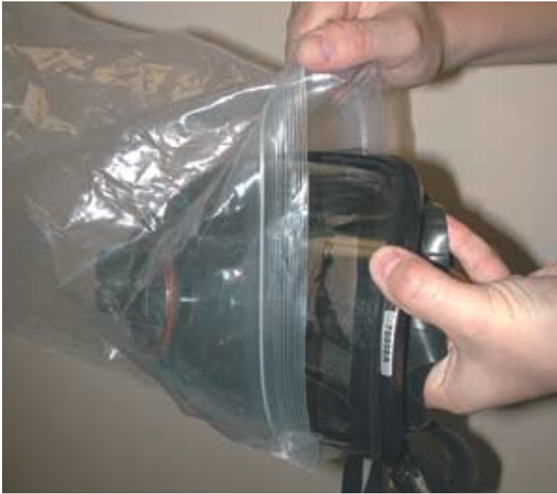
L'intérieur du sac à fermeture hermétique peut se salir à force d'être utilisé. Il faut donc le nettoyer ou le remplacer régulièrement.

avec la peau et le souffle de l'utilisateur précédent. À chaque échange, le masque doit donc être nettoyé tel que décrit précédemment puis désinfecté selon les instructions suivantes.