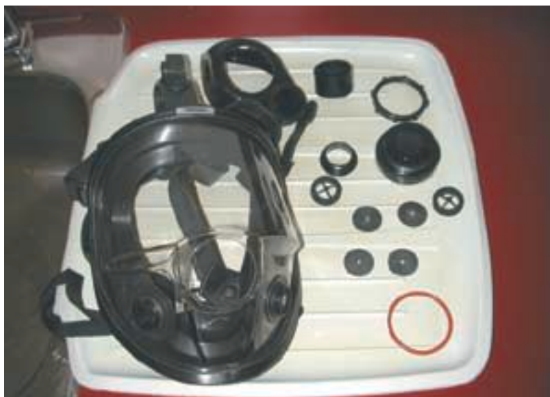
Désassembler le masque en notant bien l'emplacement de chacune des pièces.

Enlever d'abord les filtres et les cartouches. Désassembler le masque en enlevant les conduits, les soupapes inspiratoires et expiratoires, les joints d'étanchéité et toutes les autres parties détachables (consulter le manuel du fabricant - figure détaillée du masque). Remplacer toutes les parties abîmées. Une attention particulière doit être portée aux