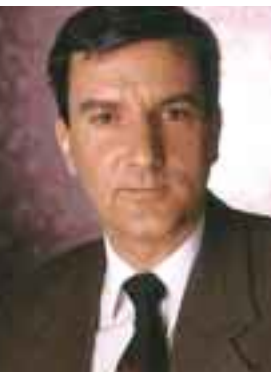
par MICHEL GAGNON Conseiller en hygiène industrielle, Auto Prévention

Alors, quels sont les risques communs à tous les gaz comprimés ? Ce sont ceux reliés à la compression du produit. En effet, dans une bouteille, le gaz est comprimé à une pression de plus de 2 000 lb/po 2 . L'acétylène, qui n'est pas comprimé à forte pression, mais plutôt « dissous » dans une substance de transport, présente les mêmes risques qu'un gaz comprimé et fait aussi partie de cette catégorie.