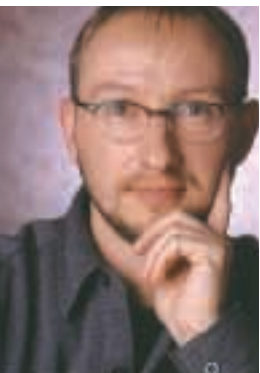
par JOCELYN JARGOT Conseiller en hygiène industrielle, Auto Prévention