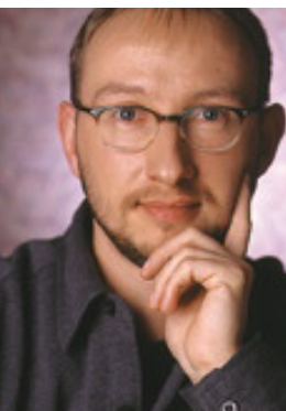
par JOCELYN JARGOT conseiller en hygiène industrielle, Auto prévention