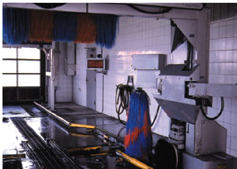
Respecter les voies de circulation prévues.

Un niveau sonore anormal peut aussi être le signe annonciateur d'une panne imminente ou du manque d'entretien d'une composante... N'attendez pas un bris pour en faire l'entretien !