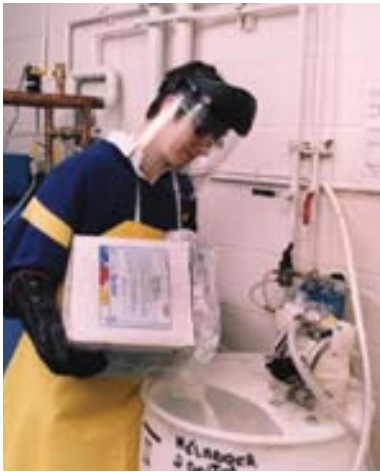
Porter les équipements de protection appropriés au procédé.

contenant est bien étiqueté, conformément au S.I.M.D.U.T.