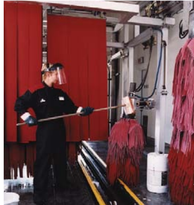
Respecter une procédure de cadenassage pour tous les travaux sur le lave-auto.